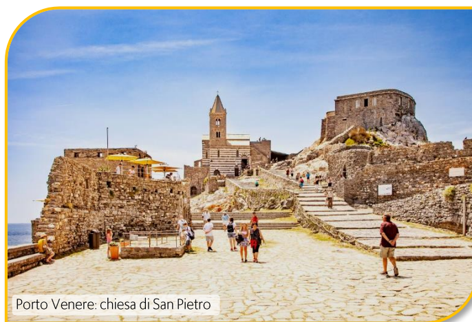
Porto Venere: chiesa di San Pietro

Ritorno a Portovenere spettacolare commistione tra arte e natura. Pranzo libero. Nel pomeriggio tempo a