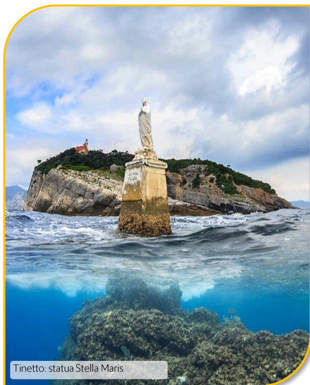
Tinetto: statua Stella Maris

La quota non include: I pasti - Gli ingressi - Gli extra personali in genere - Tutto quanto non indicato nella voce "la quota include".