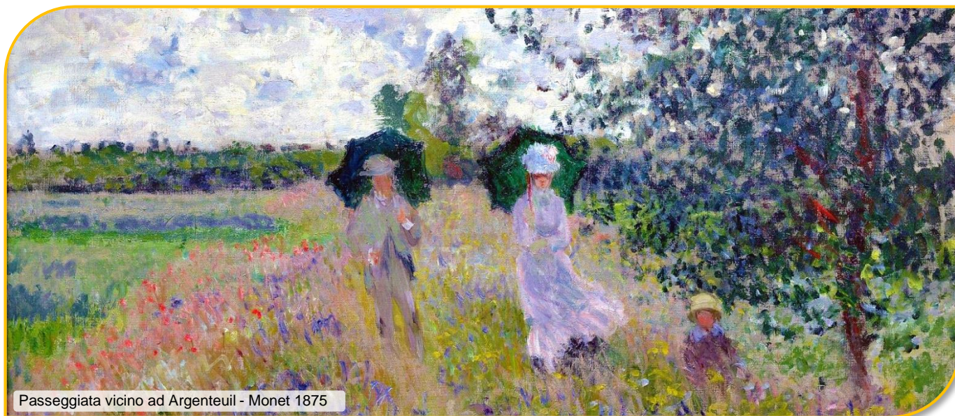
Passeggiata vicino ad Argenteuil - Monet 1875

BUS GRAN TURISMO - ACCOMPAGNATORE - VISITA GUIDATA DI MILANO INGRESSO ALLA MOSTRA DI MONET