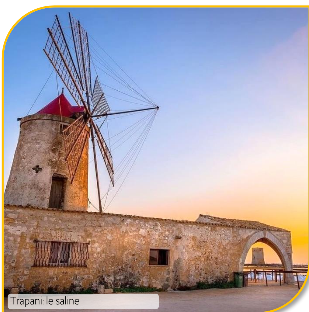
Trapani: le saline

in hotel. Mattinata dedicata alla visita dell'antica Ibla , il centro storico di Ragusa ricco di tesori architettonici e reso celebre dalla fiction televisiva "il commissario Montalbano". Tra i capolavori d'arte della cittadina barocca dichiarata dall'Unesco "Patrimonio dell'Umanità", vi sono il grandioso Duomo di San Giorgio, il portale di S. Giorgio (l'antica Cattedrale distrutta dal terremoto del 1693), il palazzo Zacco, i Giardini Iblei. Pranzo in agriturismo a base di specialità tipiche degli Iblei e breve sosta alla casa del Commissario Montalbano , a Puntasecca . Nel pomeriggio, proseguimento per Agrigento e visita della mitica Valle dei Templi dell'antica Akragas, dove si potranno ammirare i resti dei maestosi Templi della Concordia, di Giunone Lacinia, di Ercole, dei Dioscuri o Castore e Polluce, di Giove Olimpico. Sistemazione in hotel in zona Agrigento/Selinunte. Cena e pernottamento.