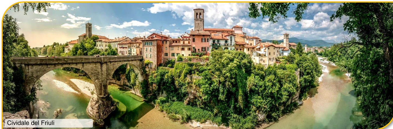
Cividale del Friuli