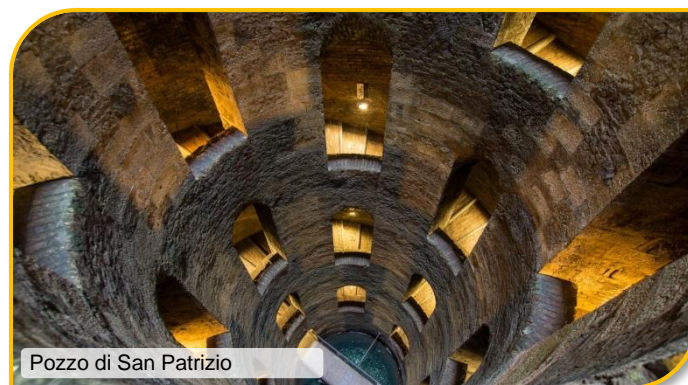
Pozzo di San Patrizio