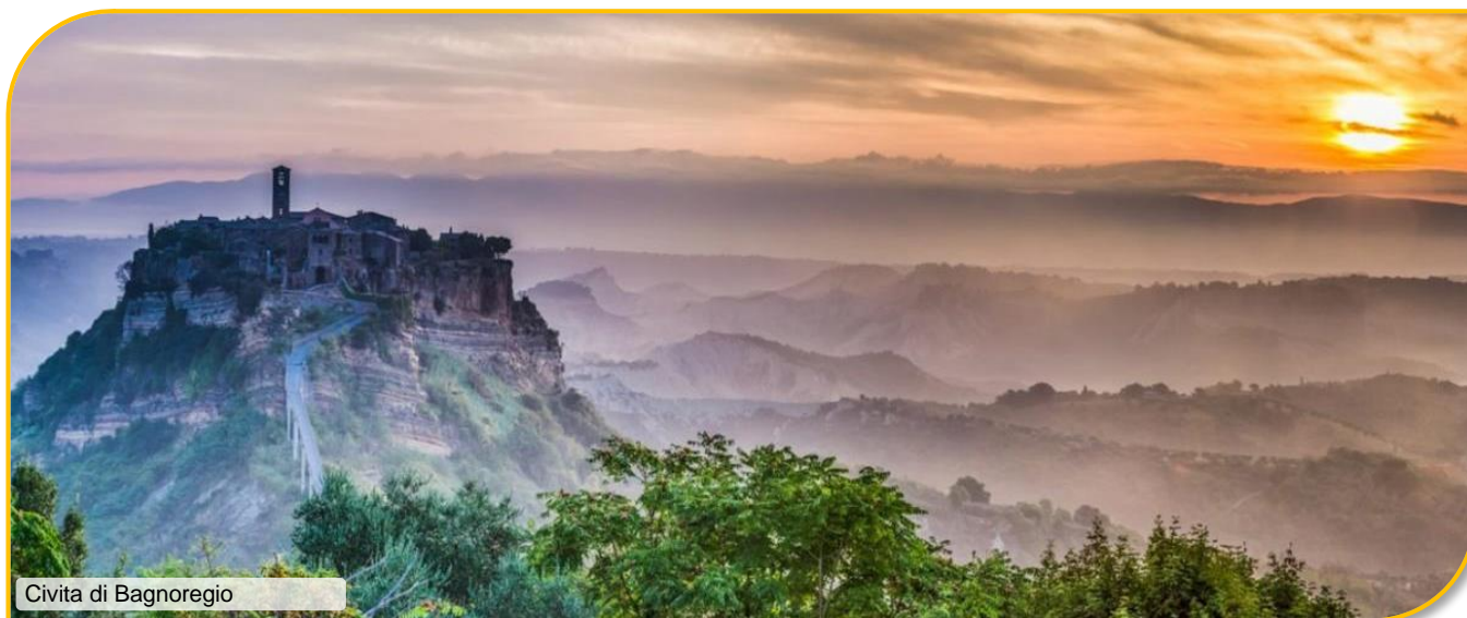
Civita di Bagnoregio

VIAGGIO IN BUS GRAN TURISMO - ACCOMPAGNATORE HOTEL 3 STELLE - TRATTAMENTO DI PENSIONE COMPLETA CON PASTI IN RISTORANTE - BEVANDE AI PASTI - VISITE GUIDATE