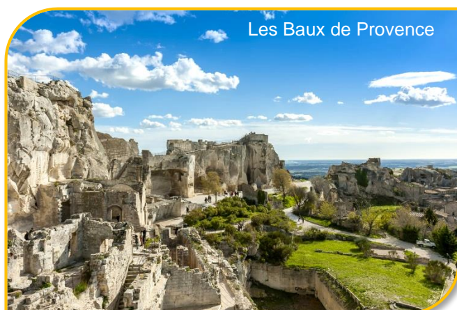
Les Baux de Provence

1° GIORNO - RIVIERA LIGURE / AIX EN PROVENCE: Ritrovo dei partecipanti nella località prescelta e partenza in bus gran turismo alla volta della Francia. Arrivo ad Aix ed Provence , breve visita del centro città, quindi pranzo in hotel. Nel pomeriggio trasferimento al parco del Castello di Florans di Antheron . Tempo libero per una cena leggera nei dintorni del castello. Alle ore 21:00 assisteremo all'interessante concerto interamente dedicato a Beethoven con l' Orchestra Filarmonica di Montecarlo ed il grande Nelson Freire , virtuoso del pianoforte con il seguente programma: