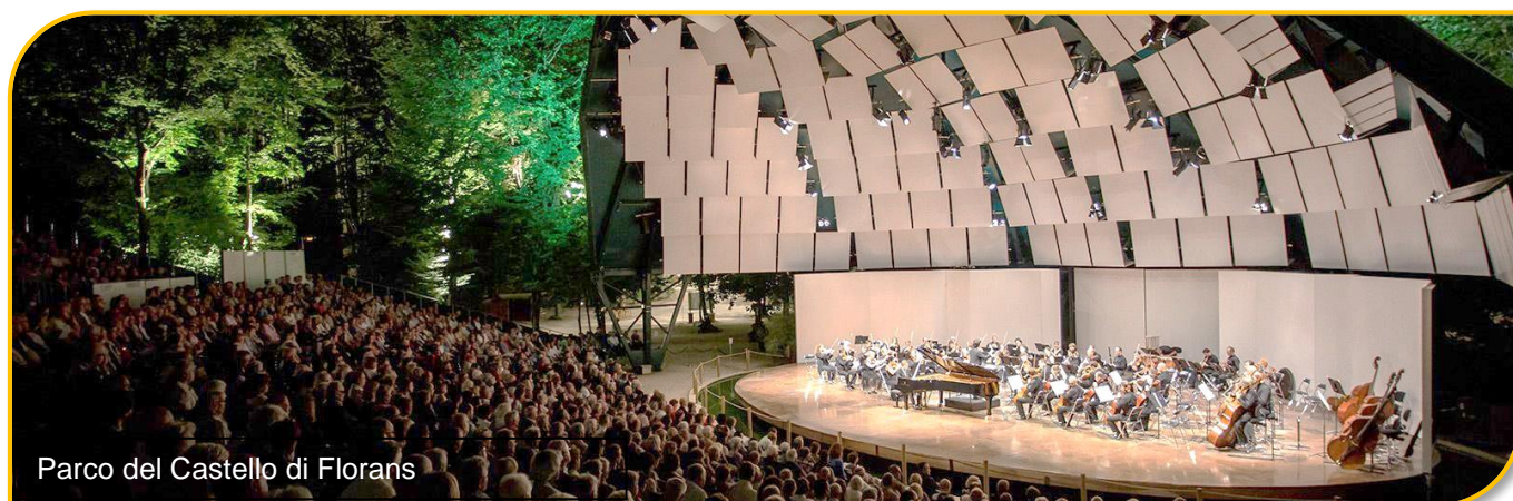
Parco del Castello di Florans

BUS GRAN TURISMO - ACCOMPAGNATORE - HOTEL 4 STELLE TRATTAMENTO DI MEZZA PENSIONE - VISITA GUIDATA E INGRESSI INCLUSI